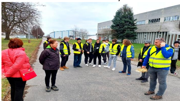
Exkurze do firmy TON