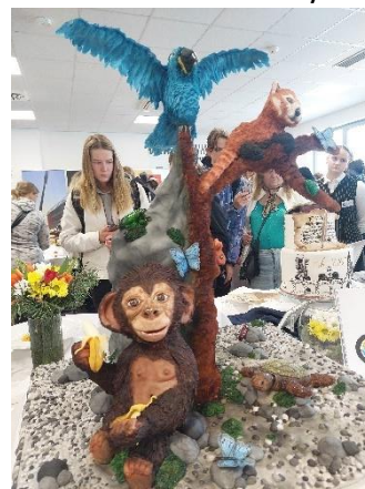
Exkurze Kompek Kladno