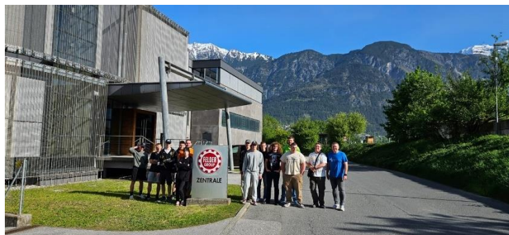
Továrna FELDER Rakousko