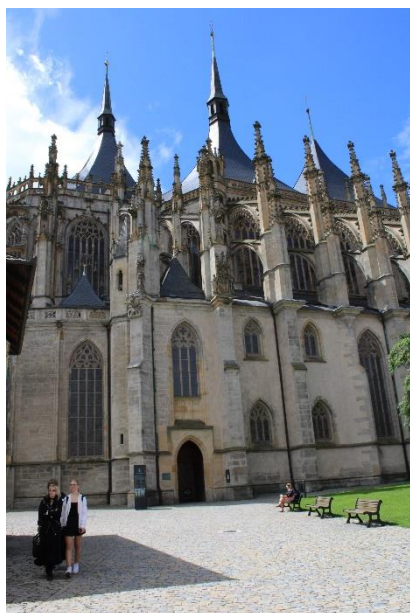
Disegno Interno Kutná Hora