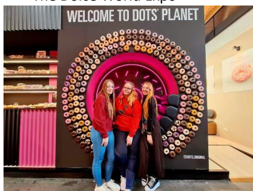
The Dolce World Expo